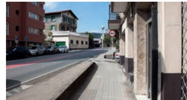
2 La eliminación de barreras arquitectónicas en Bulandegi Bidea durante este año. Bulandegi Bidean oztupo arkitektonikoak ezabatzea aurtan.