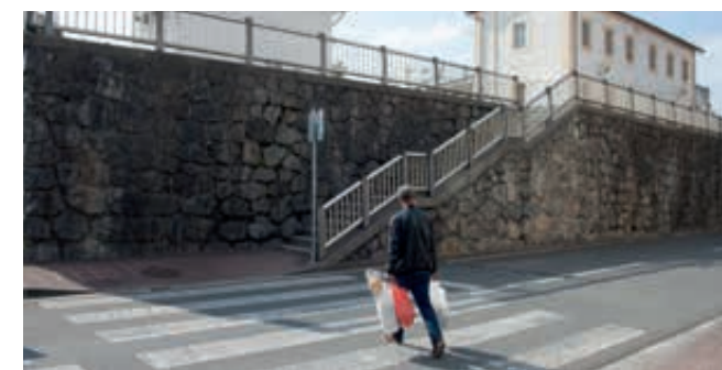
4 Modificación del paso de cebra existente entre la estación de ferrocarriles y la trasera de Ugare 5, por el riesgo evidente ante la falta de visibilidad tanto del peatón como del conductor. Tren-geltokiaren eta Ugare kaleko 5 zenbakia atzealdearen artean dagoen zebra-bidea aldatzea, oinezkoak eta gidariak ikuspenik ez izateak eragiten duen ageriko arriskuagatik.

Esperamos que con la propuesta que hemos incorporado en los presupuestos de 2021 para la reordenación de tráfico en la zona de la estación y ampliación de aceras a ambos lados, se eliminen los riesgos de atropello de las y los usuarios del servicio de transporte de cercanías, ampliando la zona peatonal para su disfrute de las y los viandantes.