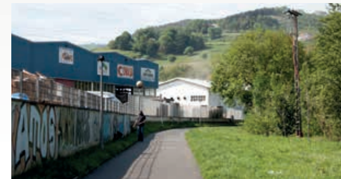
8 Mejora de la iluminación en el bidegorri que discurre paralelo al río Oria y el polígono 15. Oria ibaiaren eta 15. poligonoaren paraleloan doan bidegorriaren argiztapena hobetzea.

Sin olvidar, que ya es una realidad la cubierta de la Plaza Pásus que propusimos desde el PSE-EE de Zizurkil.