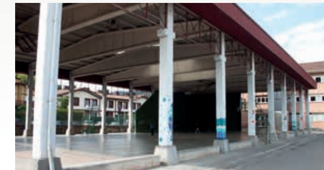
7 El cierre del frontón del Colegio Público Pedro M o Otaño para poder incrementar las opciones de realizar deporte. Pedro M o Otaño Ikastetxe Publikoko frontoia ixtea, kirola egiteko aukerak areagotzeko.