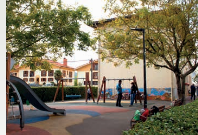
6 El cubrimiento del parque infantil en Zizurkil Goia. Zizurkil Goia haur-parkea estaltzea.