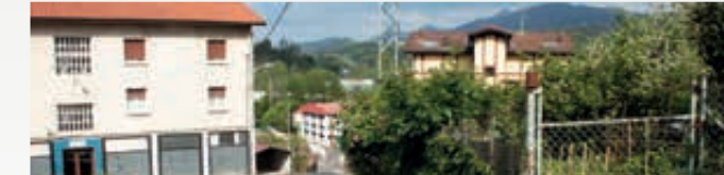
1 La renovación urbanística de los barrios Akezko e Ihartza. Akezko eta Ihartza auzoen hirigintza-berritzea.