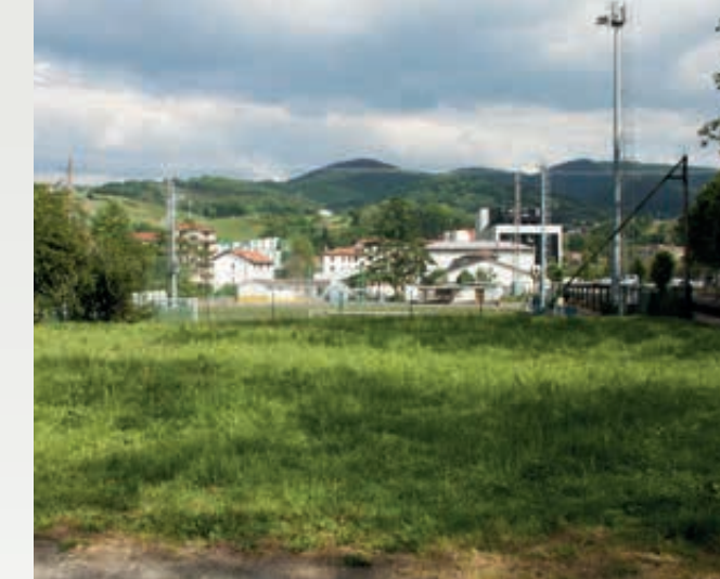
5 La instalación de una zona deportiva junto al campo de fútbol. Futbol-zelaiaren ondoan kirol-eremu bat jartzea.

Espero dugu geltokiaren inguruko zirkulazioa berrantolatzeko eta oinezkoentzako gunea handituz espaloiak bi aldeetara zabaltzeko 2021eko aurrekontuetan sartu dugun proposamenarekin, aldiriko garraio-zerbitzuaren erabiltzaileek ibilgailu batek harrapatzeko dituzten arriskuak ezabatzea.