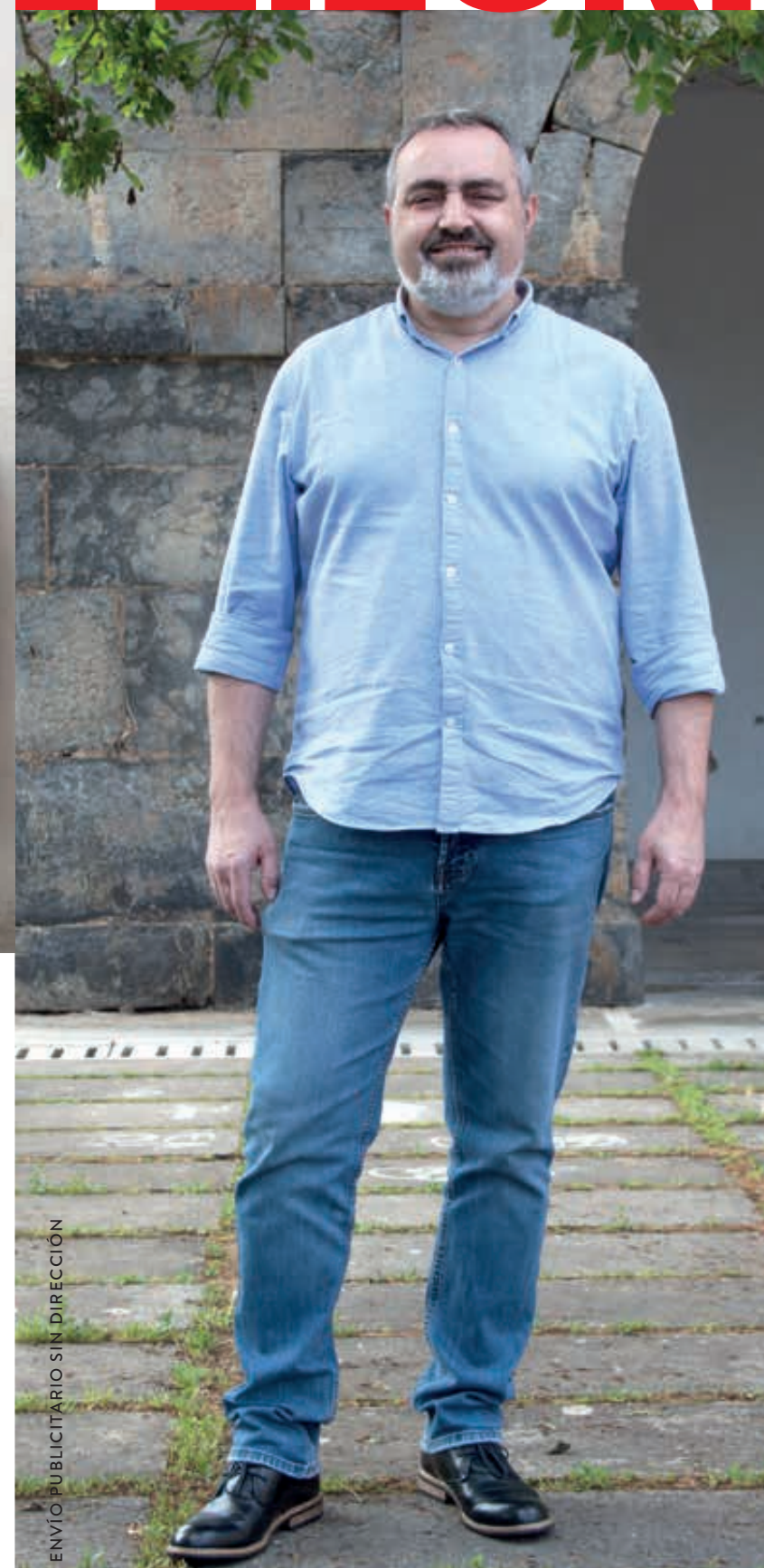
ENVÍO PUBLICITARIO SIN DIRECCIÓN