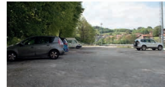
3 La mejora del aparcamiento en las inmediaciones del campo de fútbol. Futbol-zelaiaren inguruko aparkalekua hobetzea.