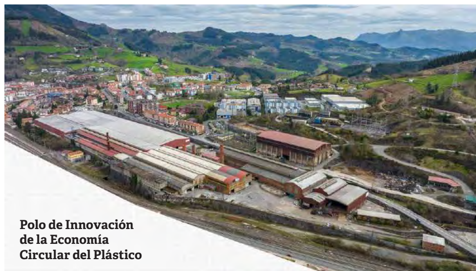
Polo de Innovación de la Economía Circular del Plástico

Continuar impulsando las ayudas ZuEKIN Berritu para el desarrollo de proyectos e inversiones en i+d+i para la mejora competitiva de nuestras pequeñas y medianas empresas industriales.