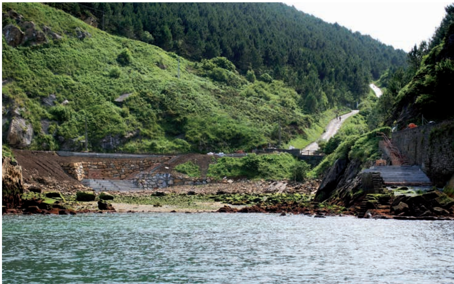
Cala Alabortza (Donibane). Alabortza kala (Donibane).

HAY QUE PROMOVER E INVERTIR RECURSOS EN LA MEJORA DE LOS POCOS ESPACIOS DE LOS QUE DISPONEMOS PARA DISFRUTAR DEL OCIO EN LA NATURALEZA.