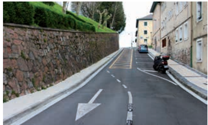
Calle Hermanos Urrestarazu (San Pedro). Urrestarazu Anaien kalea (San Pedro).

Asfaltoa hobetu eta konpontzeko lanak egin behar ziren puntutan jardun dugu. Izan ere, leku horietan, ibilgailuen trafikoaren ondorioz —ibilgailuen eta oinezkoen zirkulazioaren segurtasuna hobetzeko—, galtzadak oso egoera txarrean zeuden, edo puntu horiek beste zerbitzu batzuetara egokitzeko lan batzuk egitea eskatzen zuten —adibidez, garraio publikorako sarbidea hobetzea—.