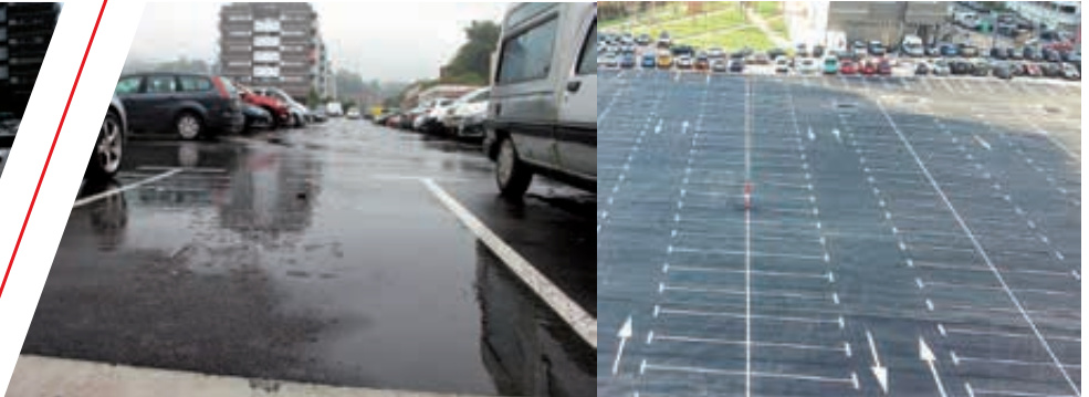
Parking Luzuriaga después de la actuación (Antxo). Luzuriaga aparkalekua lanak amaitu ondoren (Antxo).

Hemos actuado en puntos que requerían acciones para la mejora y reparación del asfaltado en espacios del municipio cuyas calzadas estaban, o bien muy deterioradas por la rodadura de los coches, mejoras de seguridad para la circulación viaria y peatonal, o requerían de actuación para adecuarlas a otros servicios, como un mejor acceso para el transporte público.