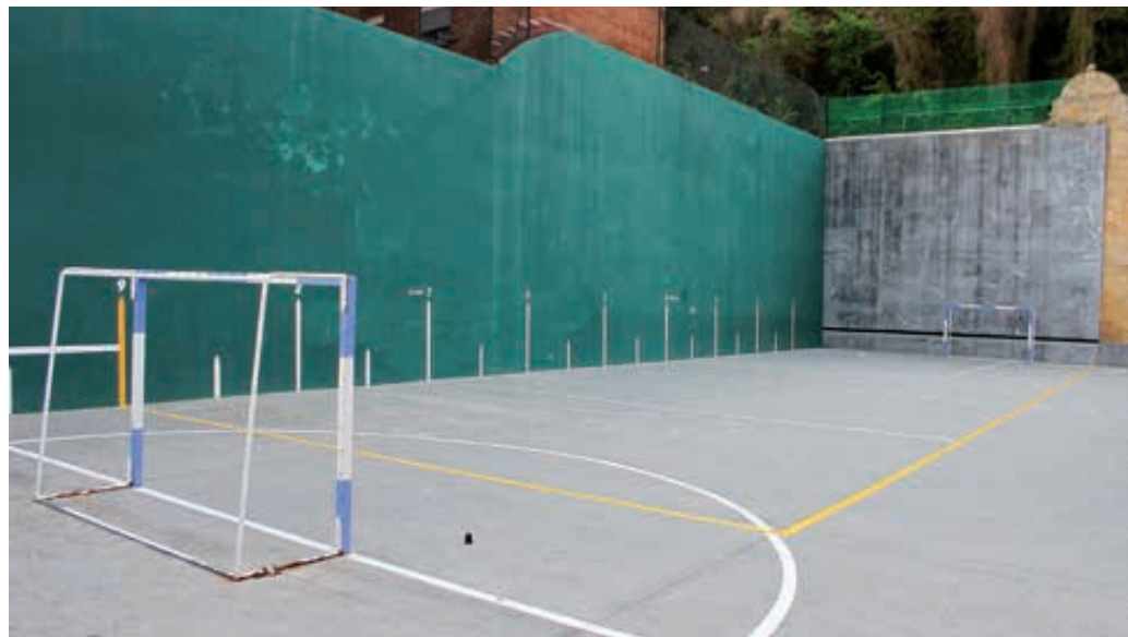
Frontón (San Pedro). Frontoia (San Pedro).

Era berean, adin guztietako erabiltzaileek kirola egiteko aire libreko espazioak sortzea.