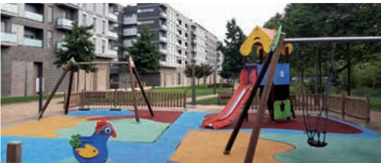
Parque Luzuriaga (Antxo). Luzuriaga parkea (Antxo).