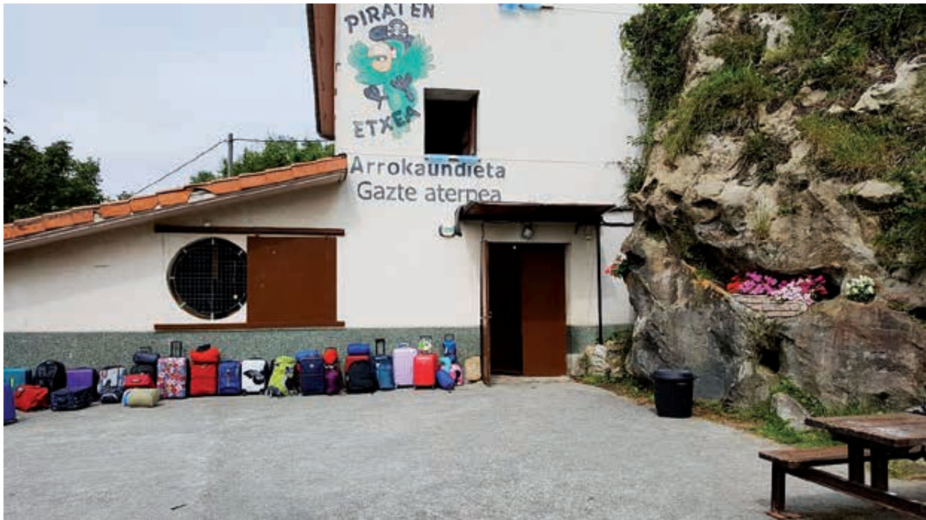
Albergue Arrokaundieta (San Juan). Arrokaundieta aterpetxea (Donibane).

Hobetzeko, mantentzeko eta irisgarri egiteko lan espezifikoak aspalditik egitea eskatzen zuten ingurunetan jardun dugu, hauek iraganean zuten paisaia-balioa eta balio naturala berreskuratzeko. Hala, berriro aisiarako eta naturarako erreferente izango dira, eta pasaitarrek ingurune horietaz aire librean gozatu ahal izango dute.