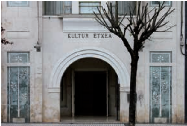
Casa de cultura (Antxo). Kultur Etxea (Antxo).

Mantentzea eta irisgarritasuna hobetzeak, eta gazteen eta helduen jarduerak burutzeko espazio berriak sortzeak ez du kulturaren bakarrik inbertitzea esan nahi, baita elkarlana eta bizikidetzaren bezalako balioetan ere. Hauek oso garrantzitsuak dira elkarte askoren lana sustatzeko eta bere garrantzia azpimarratzeko, udalaren esparrutik sustatzen diren jardueren osagai garrantzitsu gisa.