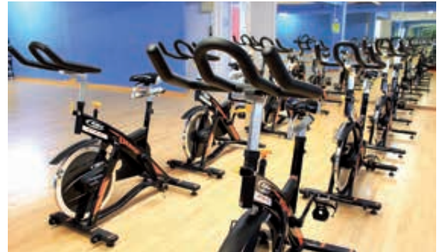
Sala de spinning. Polideportivo de Trintxerpe. Spinning-gela. Trintxerpeko kiroldegia.

También generar espacios al aire libre para la práctica deportiva de usuarios de todas las edades.