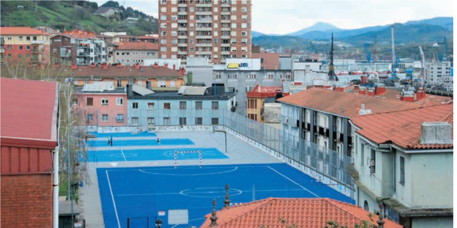
Pistas Araneder (Trintxerpe). Araneder pistak (Trintxerpe).

RECUPERAR Y MEJORAR EL MANTENIMIENTO DE ESPACIOS DEPORTIVOS TAMBIÉN HA SIDO UN OBJETIVO EN EL QUE HEMOS TRABAJADO DESDE EL AYUNTAMIENTO.