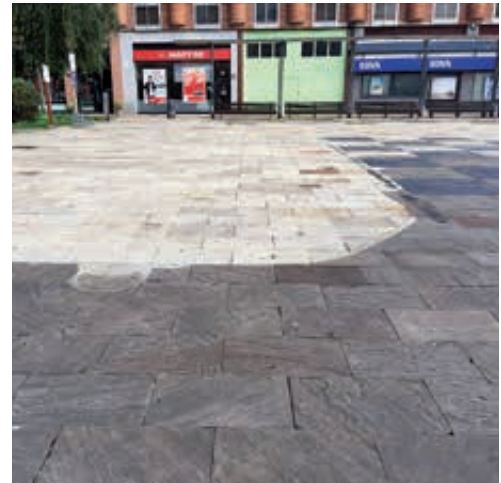
Plaza de los gudaris (Trintxerpe). Gudarien Plaza (Trintxerpe).