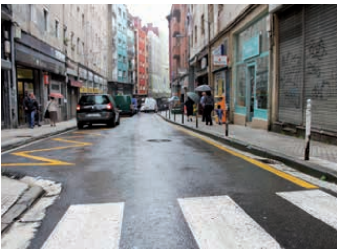
Calle Azkuene (Trintxerpe). Azkuene kalea (Trintxerpe).

Hemos actuado en puntos que requerían acciones para la mejora y reparación del asfaltado en espacios del municipio cuyas calzadas estaban, o bien muy deterioradas por la rodadura de los coches, mejoras de seguridad para la circulación viaria y peatonal, o requerían de actuación para adecuarlas a otros servicios, como un mejor acceso para el transporte público.