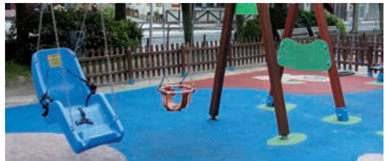
Parque en Donibane. Donibane parkea.