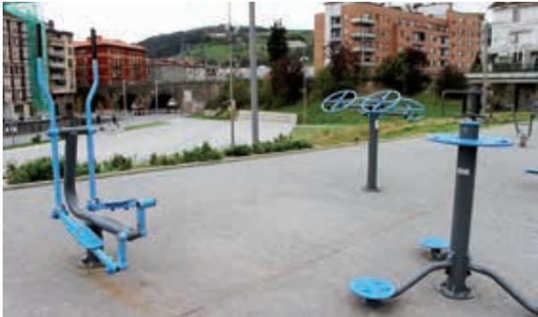
Parque para mayores (Antxo). Adinekoentzako parkea (Antxo).

KIROL-ESPAZIOAK BERRESKURATZEA ETA ESPAZIO HORIEN MANTENTZE-LANA HOBETZEA ERE UDALAREN HELBURU IZAN DIRA.