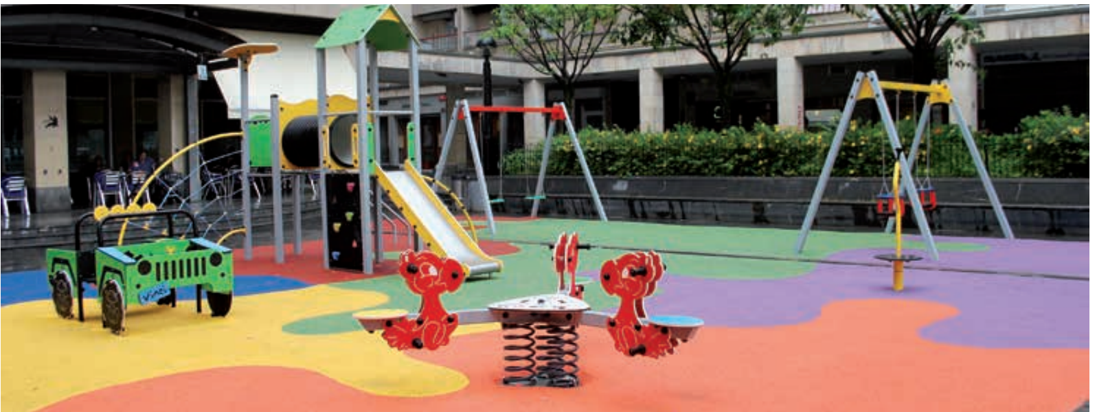
Parque Axular (Antxo). Axular parkea (Antxo).

Gure haurren aisiarako eta jolaserako guneek modernoak, atseginak, seguruak eta guztiek erosotasunez erabil dezaten bermatzeko egokituak izan behar dute.