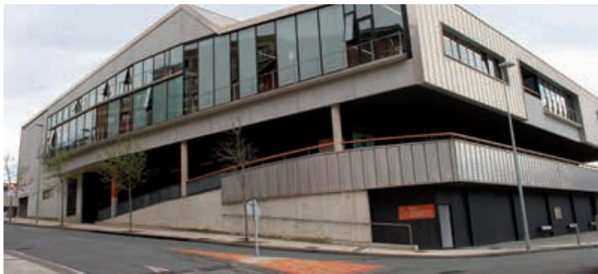
Polideportivo (Donibane). Polikiroldegia (Donibane).

Promover la modernización y mejora de espacios con escaso uso y mejorar las labores de mantenimiento de espacios deportivos de uso público y gratuito.