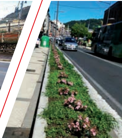
Avda. de Navarra después (Antxo). Nafarroako Hiribidea orain (Antxo).