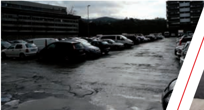
Parking Luzuriaga antes de la actuación (Antxo). Luzuriaga aparkalekua lanak egin aurretik (Antxo).

UNA PARTE IMPORTANTE DE LAS TAREAS DE MANTENIMIENTO ESTÁ REFERIDA A LAS VÍAS PÚBLICAS. MANTENTZE-LANEN ZATI GARRANTZITSU BAT BIDE PUBLIKOEI LOTURIK DAGO.