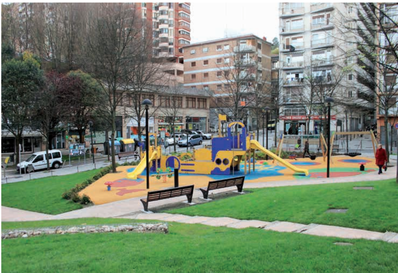
Parque Azkuene (Trintxerpe). Azkuene parkea (Trintxerpe).

Los espacios de esparcimiento y juego de nuestros niños y niñas deben ser modernos, agradables, seguros y adaptados para garantizar el uso cómodo de todos y todas.