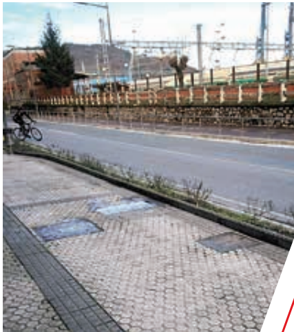
Avda. de Navarra antes (Antxo). Nafarroako Hiribidea lehen (Antxo).

Espazio publikoetako inausketak egin dira jende asko pasatzen diren zonetik, zona periferikoagoetan bezala. Espaloi eta plazetako garbiketarako lan bereziak egin dira makineria espezifikoarekin. Parkeetan eta aisi guneeetan lorezaintza eta mentenu-lanak egin dira enplegu-sustapen programeetako brigada espezializatuen bidez.