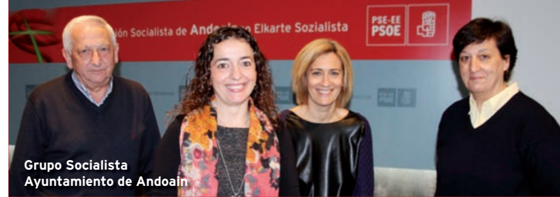
Grupo Socialista Ayuntamiento de Andoain

Los socialistas estamos de acuerdo en que también es necesaria la realización del encauzamiento del vertido de Sorabilla . Nuestra propuesta era realizarlo en 2018 , siguiendo la planificación inicial.